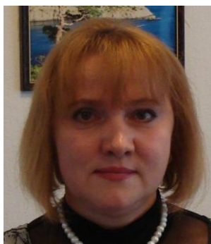
старший консультант РІЙ В. О.